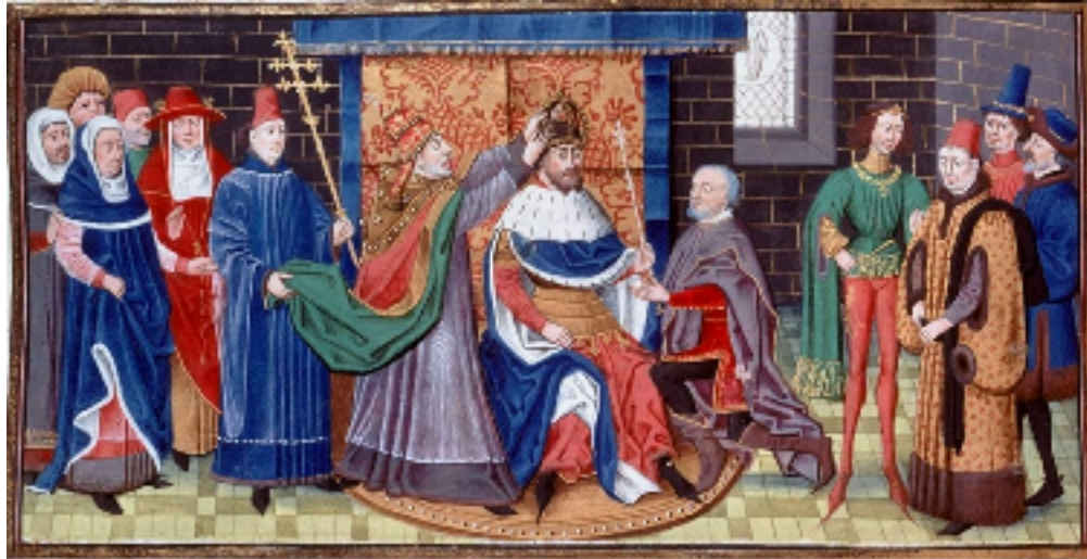
Doc. 2. Sacre de l'empereur Charlemagne par le pape Léon III. Miniature de la Chronique des Empereurs de D. Aubert, 1462.

(...) Charles se montra d'abord si mécontent (du déroulement de la cérémonie) qu'il aurait renoncé, affirmait-il, à entrer dans l'église ce jour-là, bien que ce fût pour de grande fête, s'il avait su d'avance le plan du pape.