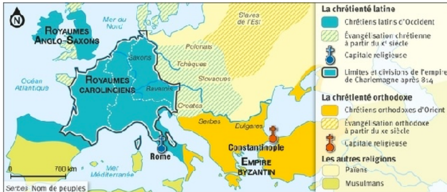
Doc. 4. Carte des empires carolingien et byzantin

Charlemagne est le fils de Pépin le Bref, roi des Francs. À la mort de son père, il devient à son tour roi des Francs en 768 avec son frère. Après la mort de ce dernier, il régna seul sur le royaume. Pendant son règne, il agrandit considérablement son royaume, d'abord vers l'Italie : il devient roi des Lombards (une région au nord de l'Italie). Il fait aussi la conquête des territoires situés aujourd'hui en Allemagne.